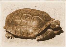
Bilde over: © Robert Fonda